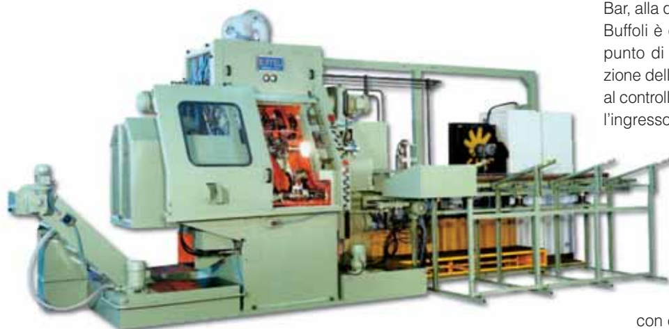
Sopra: la prima macchina da barra realizzata da Buffoli. Sotto: una vecchia macchina a tavola rotante sospesa.

con cambio utensile in soli 0,4 secondi, oppure macchine transfer integranti veri e propri centri di lavoro con cambio utensile da magazzino; entrambe le soluzioni sono state brevettate e rappresentano le linee di macchine transfer flessibili Trans-N-Center (Fast e Maxi) e i centri di lavoro multi-stazione della serie Omni-Flex (Mono-Center, Tri-Center e 5-axis Quattro). "A proposito di quest'ultima macchina - indica il manager - la Buffoli è stata la prima azienda a realizzare centri di lavoro a 5 assi basati sulla tecnologia dei motori coppia e dotati di più mandrini. La tecnologia dei 'torque motor' è stata poi portata su tavole rotanti, su morse rotanti e su morsetti girevoli in continuo. Anche in questo caso le soluzioni sono state brevettate e consentono di far ruotare in continuo, senza ritorno alla posizione iniziale, tavole rotanti su cui sono installate fino a 10 tavolette rotanti in continuo per posizionare il pezzo su qualunque