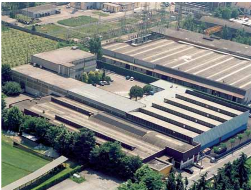
Una panoramica dello stabilimento di Brescia.

Ciò significa per il cliente un rapido ritorno dell'investimento e minimizzazione del costo per pezzo prodotto, con la possibilità di realizzare lotti economici anche di poche migliaia di pezzi, nonché produzioni non presidiate fino a un intero turno lavorativo. Inoltre, le nostre macchine ga-